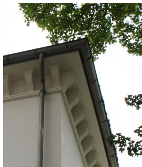
↑ Tagudhængets udskårne spærender er erstattet af en gesims båret af støbte konsoller. Rosenvængets Sideallé 6.

Villaerne fra den sene periode har stort set alle fra begyndelsen været udstyret med ”knopskydninger” som karnapper, verandaer o.l., og mange af dem er blevet bygget til siden opførelsen. Nye tilbygninger kan, ud fra en arkitektonisk betragtning, derfor godt føjes til en sådan villa, så længe den respekterer størrelsesforholdene de enkelte bygningsdele imellem og ikke tager magten fra det bestående anlæg. De bedste eksempler på tidligere til- og ombygninger har det tilfælles, at de er bygget af de samme materialer som det oprindelige hus og derfor ikke står i skarp kontrast til det.