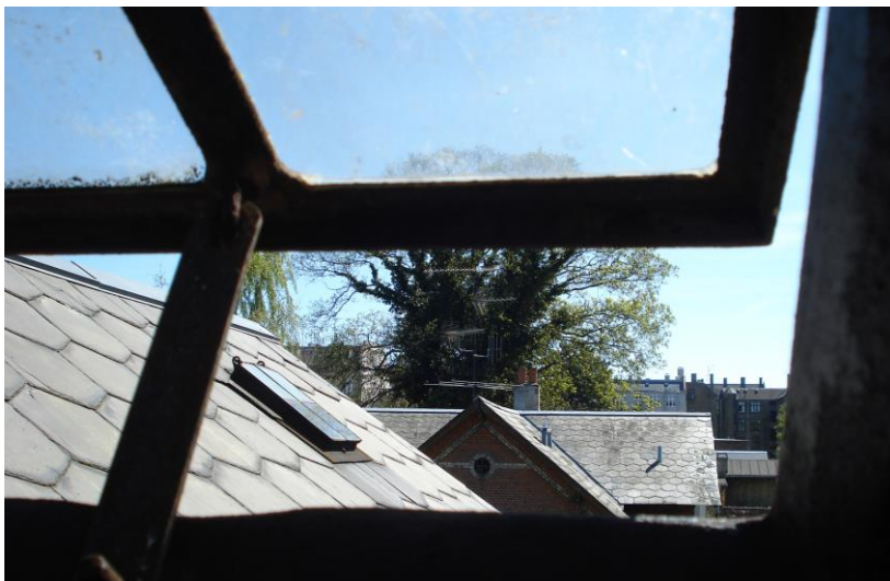
De historicistiske huse havde alle skifertag fra begyndelsen.

Tagene på de historicistiske villaer er næsten uden undtagelse af naturskifer. Der har i tagene oprindeligt kun været nogle ganske få jerntagvinduer til at give lys til et uudnyttet loft – eller måske til et pigekammer. Ønsket om den sydlandske betoning af facaden snarere end taget gjorde, at man som regel undgik tagkviste. De ville tiltrække sig for meget opmærksomhed og i øvrigt på grund af trempelkonstruktionen komme til at sidde meget højt over tagetagens gulv. De egentlige værelser var placeret i gavlene eller bag frontkvisten, hvor der sad vinduer i facaden.