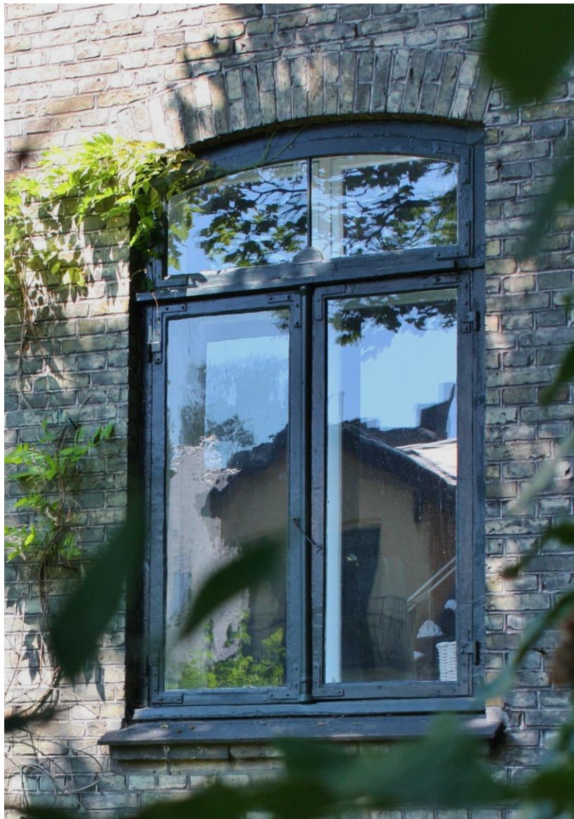
← Et smukt og velholdt originalt vindue. Det buede overvindue har bevaret den karakteristiske halvmåne og sprossen i støbejern. Hjørnebåndshængslerne er naturligvis malet med i den mørkegrønne farve, som man tit benyttede i den tidlige historicisme. En detalje ved dette vindue er lodposten (det faste, lodrette stykke mellem de to nederste rammer), der er udført som en fin søjle i støbejern. I den nederste ramme til venstre er det originale glas bevaret: Dette ses af den elegante, flimrende spejling af huset overfor. Glasset til højre er nyere og næsten helt plant. Rosenvængets Allé 39.