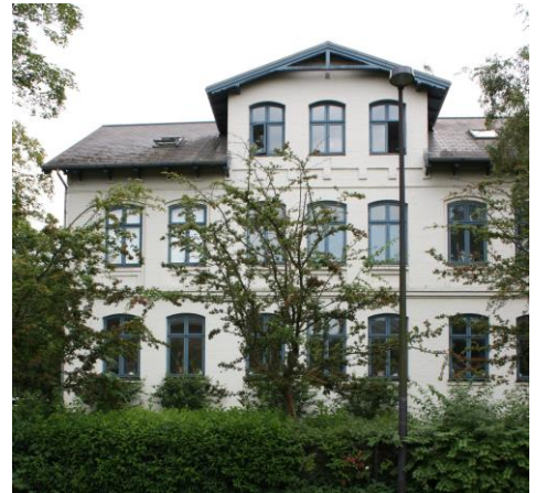
↑ Huset er på et tidspunkt blevet malet, men de støvetblå vinduer danner en fin kontrast til den lyse facade. Rosenvængets Hovedvej 14.

Tømmerdetaljer og vinduer var ofte malede i mørke og lidt støvede kulører som fx mørkebrun ("dodenkop"), mørkegrøn o.l. Man kan evt. få udført en farveundersøgelse af en konservator for at få fastlagt de oprindelige farver.