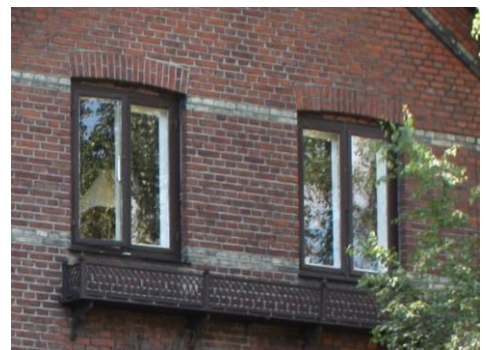
↓ En original altankasse i støbejern er en fin detalje, som det gælder om at bevare. Vinduerne er i øvrigt malet i den særlige brune "dodenkop", som man yndede i historicismen. Rosenvængets Allé 41.